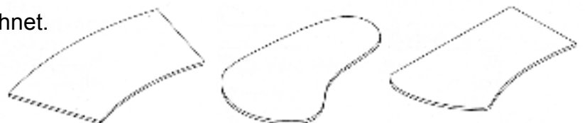
Beispiele für mögliche Plattenformen

Alle Tische sind mit einer Plattenstärke von 2,2 cm und gerader Kantenbearbeitung gerechnet. Andere Größen, Plattenstärken und Platten- formen sind natürlich auch lieferbar! Die Tischplatten sind aus Stabverleimten Vollholz und biologisch geölt/gewachst.